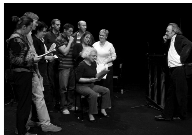
La masterclass 2006-2007

Les auditions ont eu lieu en octobre dernier : bienvenue aux 24 candidats retenus pour faire partie de la promotion 07-08 de l'ETS !