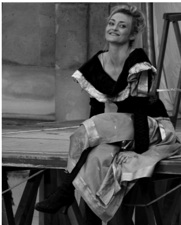
© Olivier Courtois - La Veuve rusée

quatre prétendants, un anglais, un français, un espagnol et un italien : « Une atmosphère délicieusement joyeuse qui laisse place aussi à la fantaisie. Le jeu de l'ensemble des comédiens est au diapason de la jubilation qu'a du éprouver l'auteur en écrivant sa comédie ! » D.Denorme – Pariscope. La mise en scène de Vincent Viotti a été élue coup de cœur du journal Le Parisien : « Un petit chef d'œuvre d'esprit et de drôlerie. On y retrouve la séduction, l'habileté et la fantaisie de Goldoni... On admirera un beau travail d'équipe qui ne laisse aucun temps mort et donne l'impression d'une constante improvisation ! »