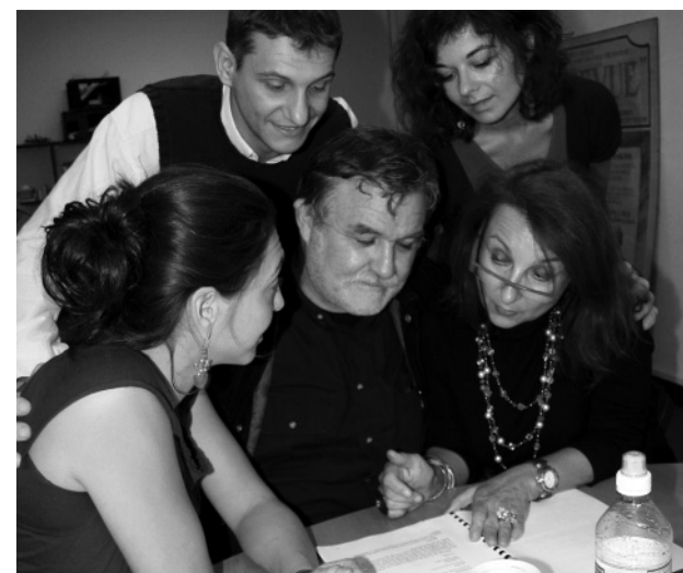
Premières répétitions de Situations critiques